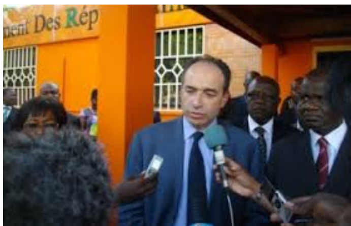
Copé chez sassou, une histoire de sous ?

Copé, qui a participé au forum Forbes Afrique au Congo Brazzaville[1] invité par Denis Sassou-Nguesso pour pérorer sur le « Développement africain et [les] enjeux économiques pour le monde ». Comme tout le sait, Copé est un africaniste distingué et sa communication, a été décisive, à tel point que l'ensemble de la communauté scientifique l'a aussitôt oubliée.