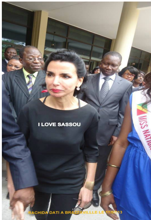
« I love ses sous »

pour le forum Forbes est retournée au Congo, invitée par le gouvernement congolais pour son expertise sur la parité, les violences faites aux femmes et le... reboisement.