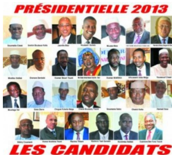
Floraison de candidats

prendre un risque important : un vote en pleine saison des pluies – quand les paysans travaillent la terre – et en plein Ramadan, allait-il vraiment pouvoir mobiliser le peuple malien ?