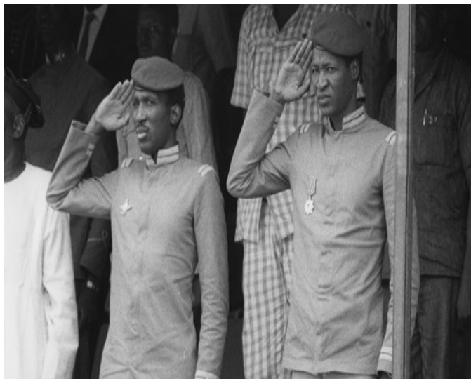
Tomas Sankara et Blaise Compaoré

L e peuple burkinabé a désormais montré à la face du monde entre 2014 et 2015 sa soif de liberté. Presque 30 ans de pouvoir compaoriste avait fait croire à Blaise Compaoré et ses sbires qu'ils étaient éternels et la tentative de putsch du général Diendéré contre le peuple fut un lamentable échec. On n'arrête pas un peuple qui a soif !